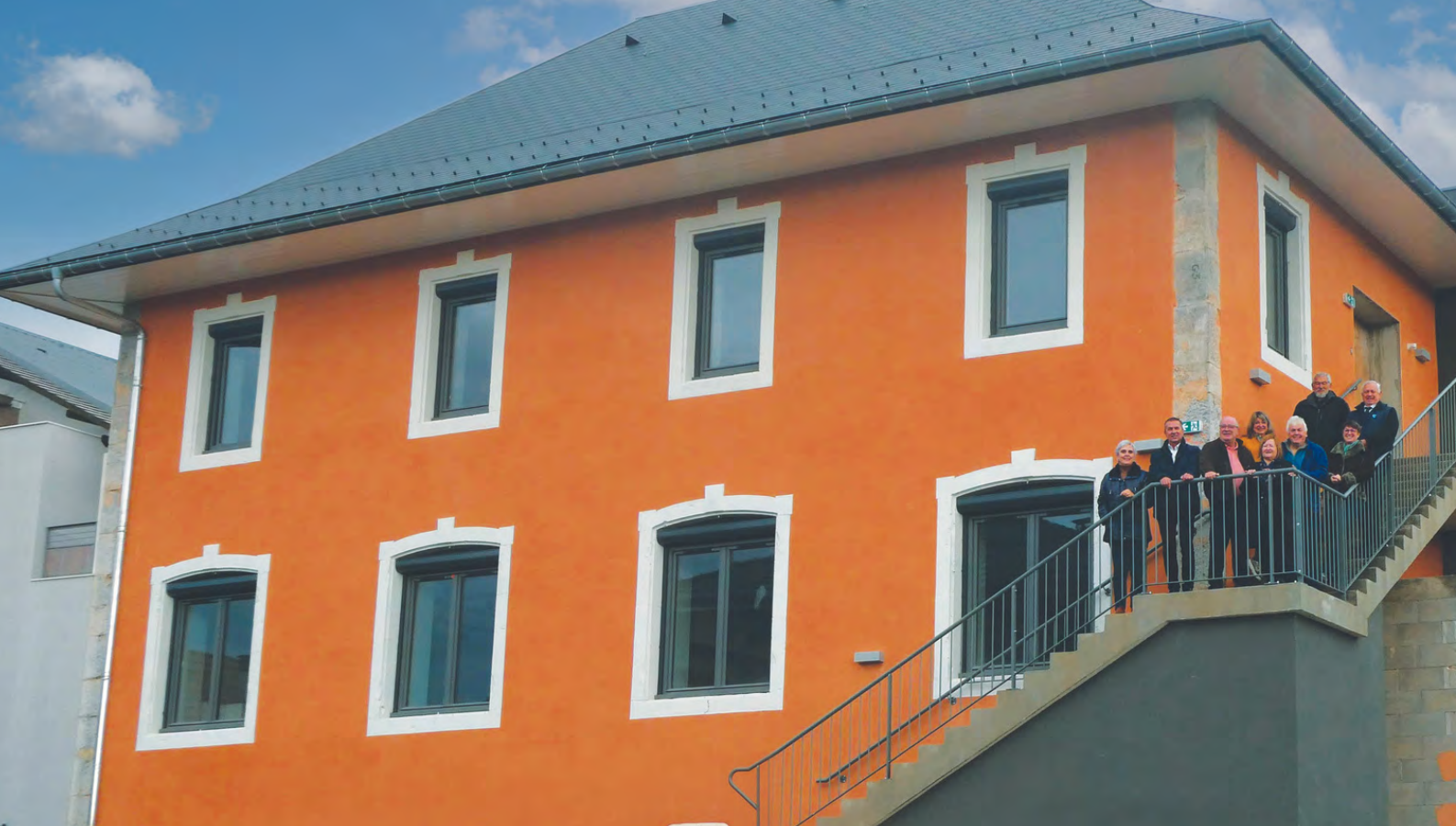
Une partie des élus et des bénévoles des Z'Amis des Z'Arts